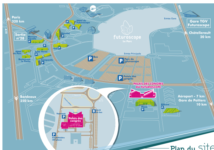
Plan du site

Dominique PETIT BORDIER d.petit-bordier@eco-industries.poitou-charentes.fr Tél : 05 49 44 97 95 - Fax : 05 49 37 41 44